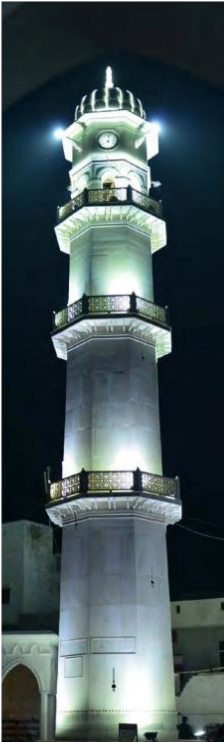
Mināratul-Masih Qadian, India

In der Tat, mit allen Kräften begabt und allmächtig ist der Gott, dessen Ihm geweihte Diener nicht vergebens leben: Jene, die zu Ihm mit Liebe und Hingabe kommen. Der Feind prahlt, dass er sie mit seinem Übel auslöschen wird und jene, die böse Absichten haben, schwören, sie auszurotten. Narren, sagt Gott, wollt ihr es wagen, mit Mir zu kämpfen und jenen zu demütigen, der Mir teuer ist? In der Tat, nichts kann auf dieser Erde passieren, bis es nicht so beschlossen wird, und keine irdische Hand kann jenseits des Endes ausgestreckt werden, das für sie in den Himmeln beschlossen ist. Daher sind jene, die Übles und grausame Anschläge planen, äusserst närrisch, dass sie während ihrer abscheulichen und schamlosen Verschwörungen jenes höchsten Wesen nicht gedenken, ohne Dessen ausdrückliche Erlaubnis es nicht einem Blatt gestattet ist, zu Boden zu fallen. Deswegen bleiben sie hinsichtlich ihrer Ziele ohne Erfolg und gehen zunichte; und den Rechtgeleiteten wird durch ihr Übel kein Leid geschehen; stattdessen werden die Zeichen Gottes weithin deutlich und das Verständnis der Menschen über Gottes Wege wird erweitert. Jener mit allen Kräften begabte und mächtige Gott, Der den Augen unsichtbar bleibt, manifestiert Sich Selbst in der Tat durch Seine wunderbaren Wege.